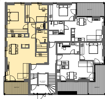
1.korruse plaan M 1:400

Möödud on ligikaudsed ja müüja jätab endale õiguse, ehituslikust eripärast tulenevalt, mõtte muuta. Palume möödud vajadusel alati üle täpsustada. Hilisemaid pretensioone kahjuks ei arvestata. Meeldivat tutvumist plaanidega.